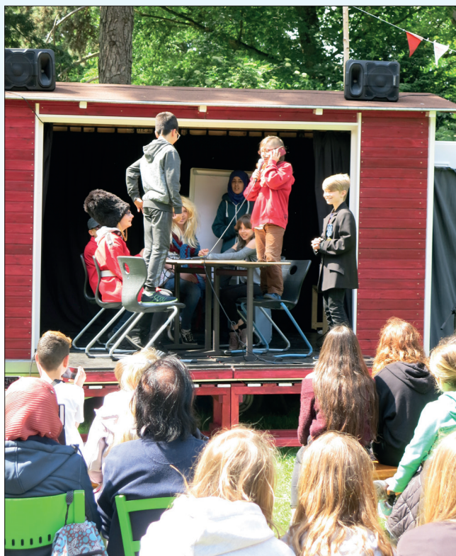
Präsidententreffen; Schüler*innen der Sekundarschule-Süd in Castrop-Rauxel

zung Mercator. Die eigenen persönlichen und sozialen Kompetenzen durch die kulturelle Bildung und erlebnisorientiertes Lernen zu stärken, ist das Ziel des Projekts, das sich an Schüler*innen der 5./6. Klassen in den Kohlerückzugsregionen richtet. Einblicke in diesen Prozess präsentierten die jungen Schausteller*innen, Performer*innen und Künstler*innen auf dem Jahrmarkt international.